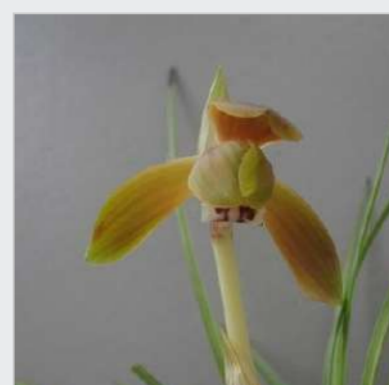
2月です！！ 追伸 1